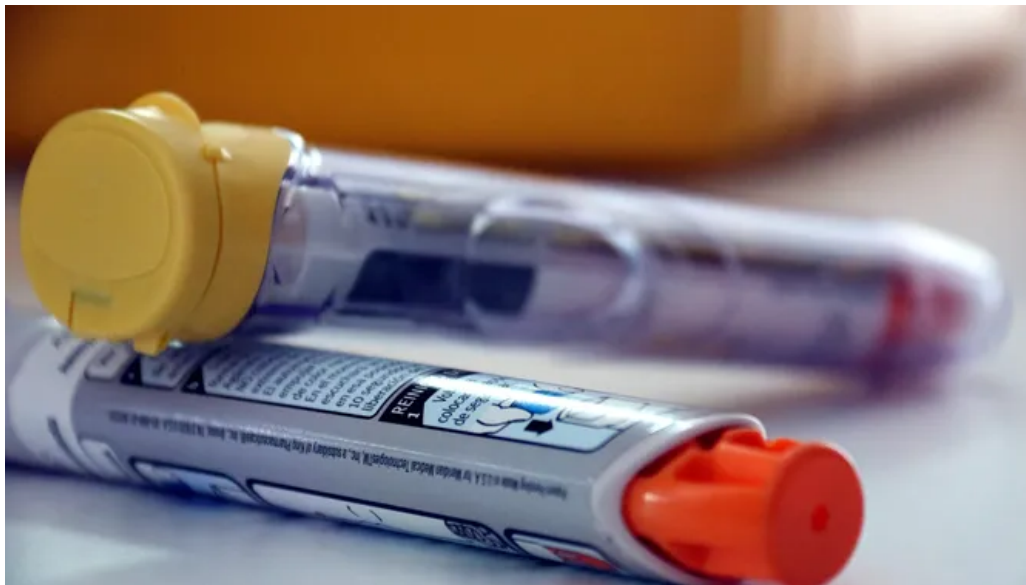
Dos administradors d'adrenalina